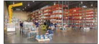
Houston, TX, États-Unis VelTEX