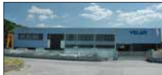
Lucca, Italie Velan ABV S.p.A., Usine 1