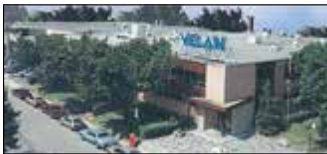
Montréal, Canada Velan Inc., Usine 1