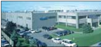
Montréal, Canada Velan Inc., Usine 2 et 7