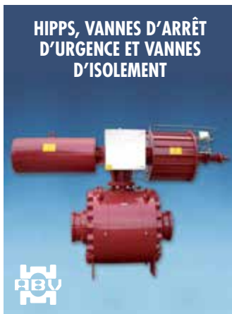
HIPPS, VANNES D'ARRÊT D'URGENCE ET VANNES D'ISOLEMENT

Unités HIPPS*, robinets à tournant sphérique, ESDV* vannes d'arrêt d'urgence à tournant sphérique et vannes d'isolement à tournant sphérique