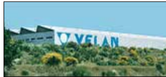
Lisbonne, Portugal Velan Válvulas Industriais, Lda.