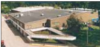
Williston, États-Unis Velan Valve Corp., Usine 3