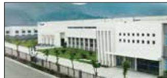
Suzhou, Chine Velan Valve (Suzhou) Co., Ltd.