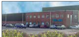
Leicester, Royaume Uni Velan Valves Ltd.