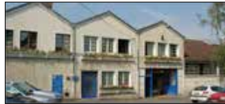
Mennecy, France Segault S.A.