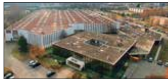
Lyon, France Velan S.A.S.