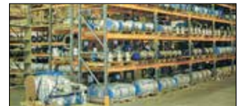
Marietta, GA, États-Unis VelEAST