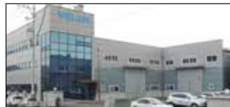
Ansan City, Corée du Sud Velan Ltd., Usine 3