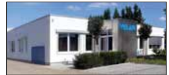
Willich, Allemagne Velan GmbH