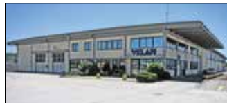
Lucca, Italie Velan ABV S.p.A., Usine 2