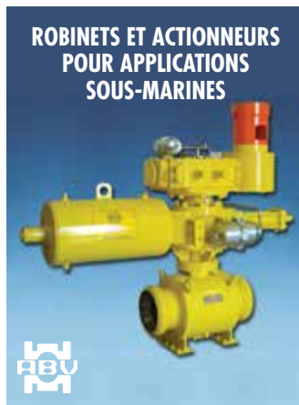
ROBINETS ET ACTIONNEURS POUR APPLICATIONS SOUS-MARINES

Robinet à tournant sphérique, robinets-vannes et clapets de non-retour pour applications sous-marines; actionneurs hydrauliques et manuels munis d'un volant/ROV en eaux peu et très profondes