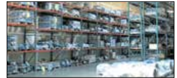
Benicia, CA, États-Unis VelCAL