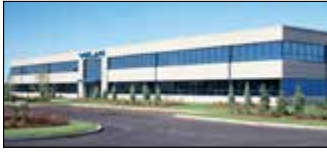
Montréal, Canada, Velan Inc.