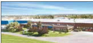
Granby, Canada Velan Inc., Usine 4 et 6