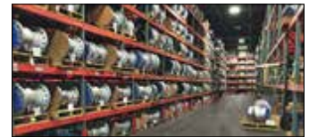
Granby, Canada VelCAN