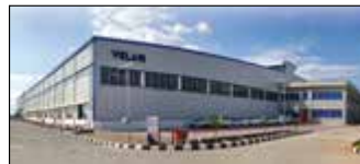
Coimbatore, Inde Velan Valves India Pvt. Ltd.