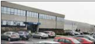
Montréal, Canada Velan Inc., Usine 5