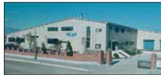
Ansan City, Corée du Sud Velan Ltd., Usine 1