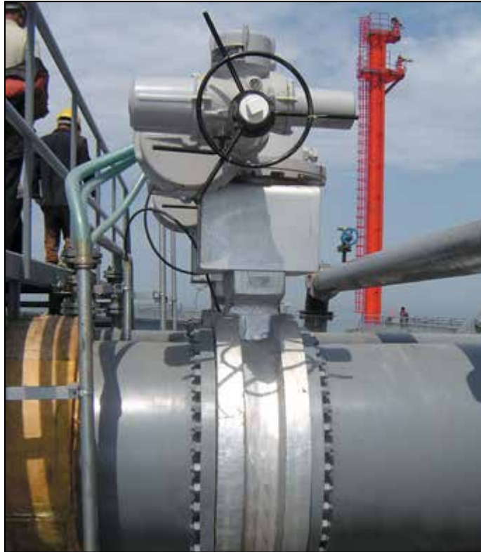
Un robinet à papillon à triple excentration Torqseal™ utilisé pour le transport du pétrole brut au port de Dalian, en Chine.

Consultez notre site Web pour des renseignements complémentaires www.velan.com