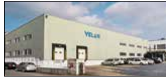
Ansan City, Corée du Sud Velan Ltd., Usine 2